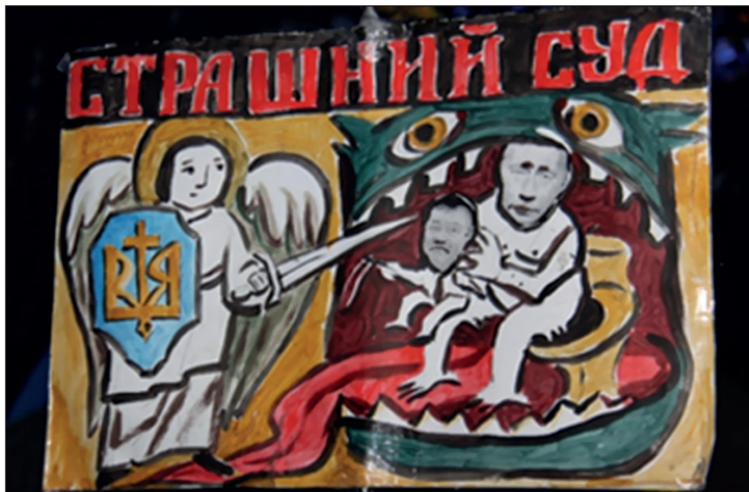
Іл. 5. Плакат «Страшний Суд».

Група плакатів характеризувала В. Януковича та провладних політиків як відвертих ставлеників В. Путіна, які перебували у його прямому підпорядкуванні та діяли в інтересах сусідньої держави. «Путінський гауляйтер» 8 , «...зрадник, чорт москальський, проклятого чорта брат і товариш, Путіна підстилка!» 9 , «Путінський холуй» 10 — це лише частина епітетів, якими характеризували В. Януковича автори плакатів. Візуальні джерела зображали його поруч із В. Путіним і Д. Медведєвим у вигляді шпани, яка захопила Україну 11 , чи як ляльку, яку смикає за ниточки В. Путін 12 . На одному з плакатів під назвою «Страшний Суд» В. Путін, сидячи у пащі дракона, тримає в руках В. Януковича (іл. 5).